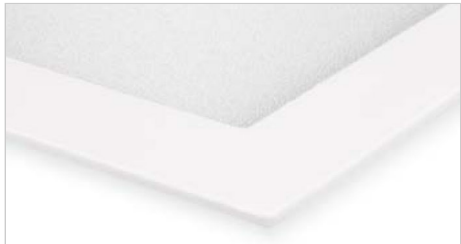
MARCO DE ALUMINIO INYECTADO